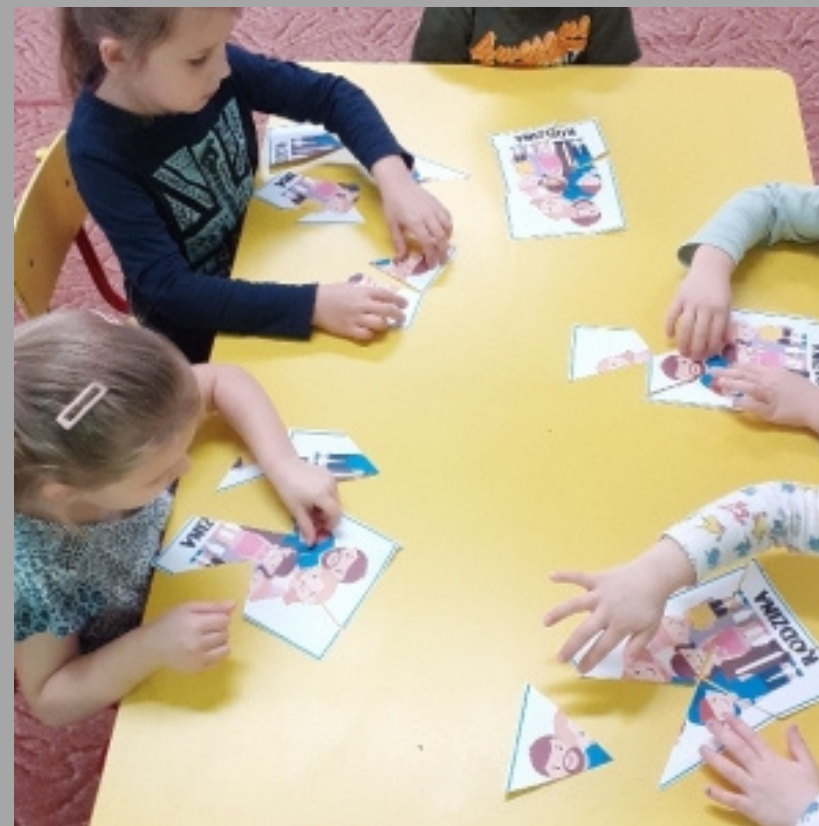
Projekt "Starsze Siostry"